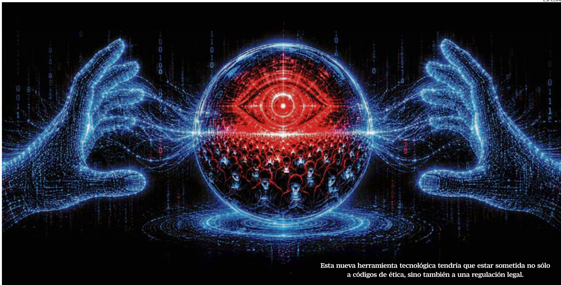
Esta nueva herramienta tecnológica tendría que estar sometida no sólo a códigos de ética, sino también a una regulación legal.