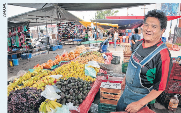
La tasa de empleo en el sector informal (comercios ambulantes, empresas familiares, micronegocios que contratan personas, pero no pueden brindarles prestaciones) se mantiene en 30%.

“Además, puede haber problemas a la hora de verificar que esta ley se cumpla, porque los sistemas de verificación no están claros y el de las plataformas digitales es un tipo de trabajo muy difícil de ubicar en un lugar específico... En suma, el balance es heterogéneo debido a que, por un lado, ya se cuenta con el reconocimiento de más derechos laborales y a que, por el otro, resulta muy complejo ver cómo los implementan las empresas y constatar que éstas se apegan a la ley en un mercado