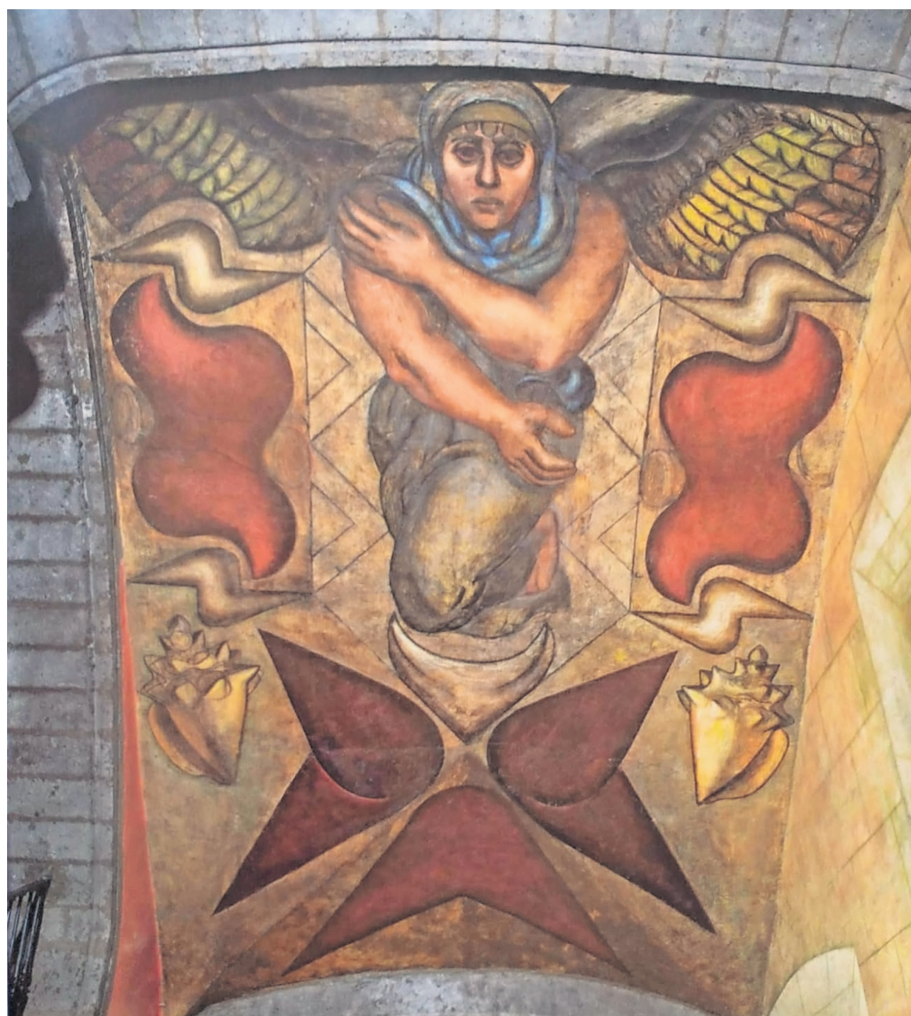
La alegoría de los cinco elementos, pintado por Siqueiros en el cubo de la escalera del Colegio o Patio Chico del Antiguo Colegio de San Ildefonso.

Todas estas obras, realizadas entre 1923 y 1924, fueron sus primeros murales y, según la investigadora universitaria, ya anunciaban de algún modo lo que Si-