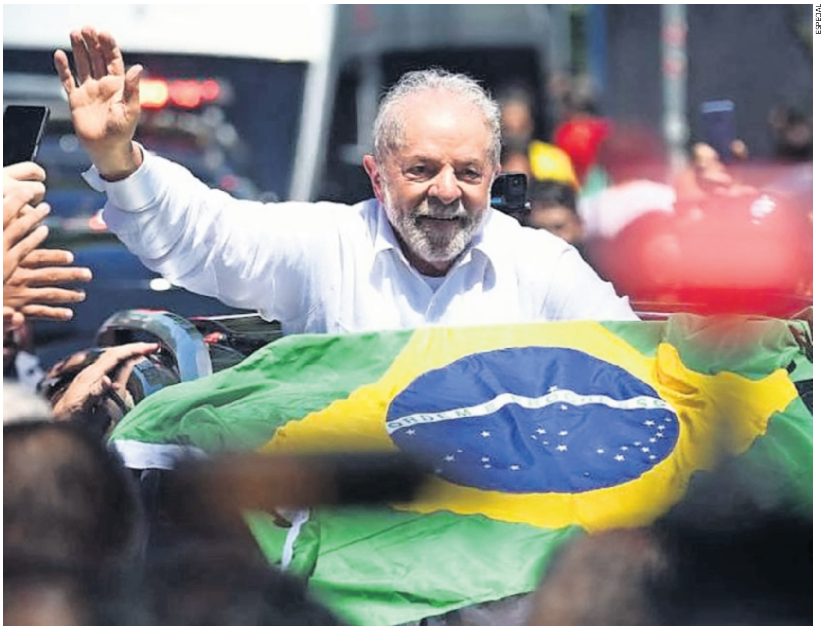
Luiz Inácio Lula da Silva asumirá por tercera vez el cargo de Presidente de Brasil el próximo 1 de enero de 2023.

“Es el caso del Partido de los Trabajadores de Brasil, que se ha vuelto electoralista y ha abandonado la organización de los sectores populares y, en particular, de los trabajadores. La izquierda está muy adaptada a determinadas reglas del sistema y no propone una ruptura con él. No es una izquierda realmente alternativa. Por ejemplo, está claro que, dada la cercanía de Lula da Silva con personajes como Henrique Meirelles, a quien podría nombrar ministro de Economía, la política económica del próximo gobierno brasileño seguirá siendo la del capital financiero. Es muy complicado presentarse como