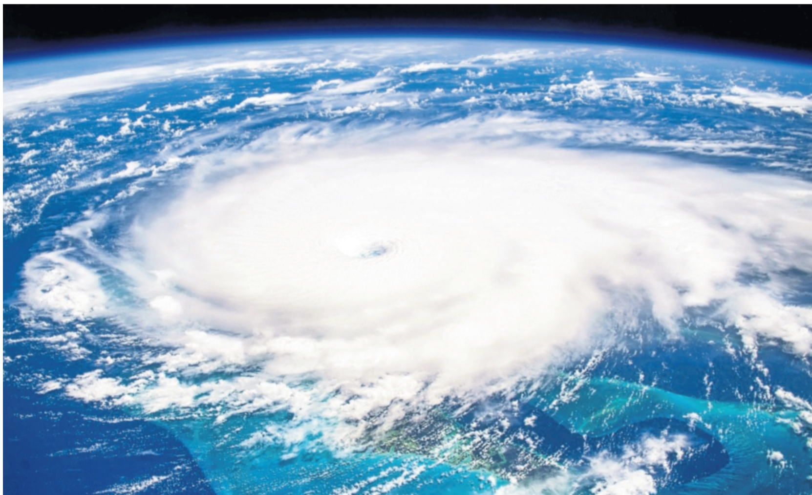
El primero de la temporada en el Pacífico, Agatha, azotó fuertemente el sur de Oaxaca.