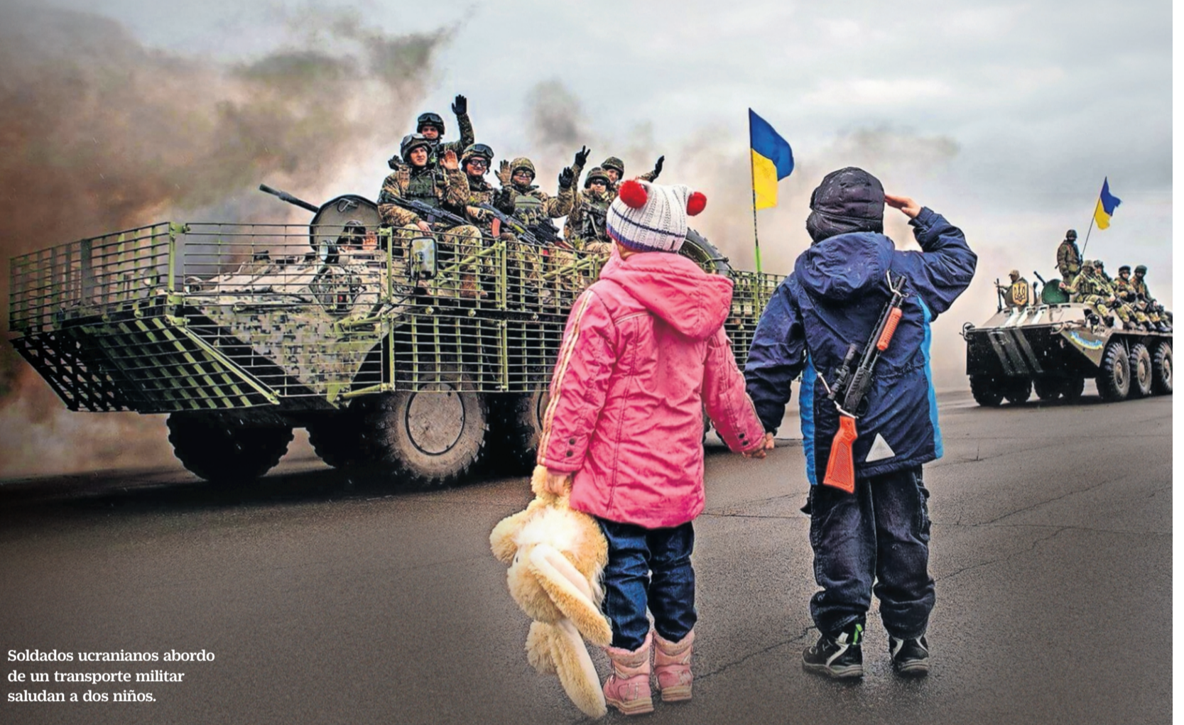
Soldados ucranianos abordo de un transporte militar saludan a dos niños.

"El uso de los medios de comunicación en un conflicto armado no