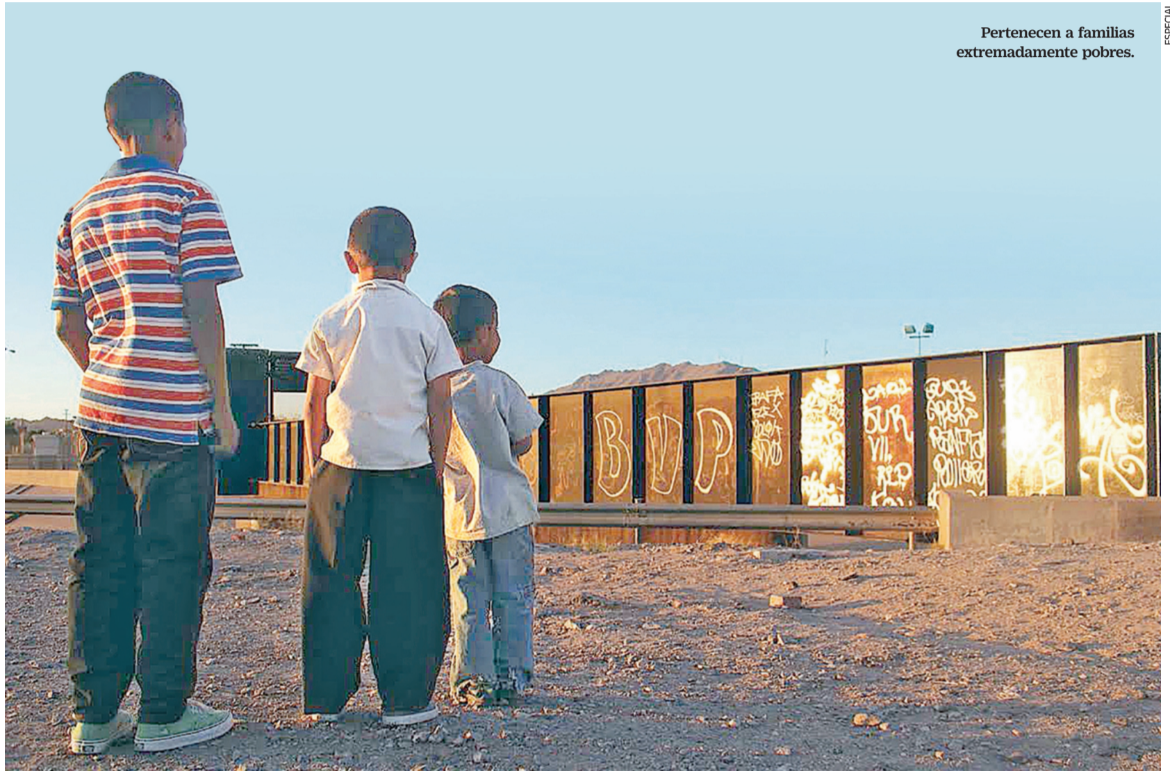
Pertencen a familias extremadamente pobres.

El estudio registra diversos casos de una muestra de esta población