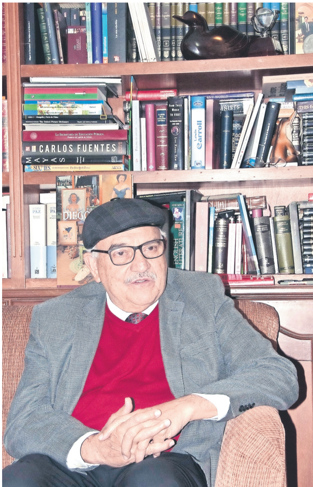
El ex líder universitario.

"Apenas lo escuchamos, nos dimos cuenta de que, en contraste con el discurso de los otros oradores, el de Sócrates era radical: prácticamente estaba llamando a las armas. Él era un tipo desaforado, pero hablaba de manera articulada, hay que decirlo. Desde ese momento,