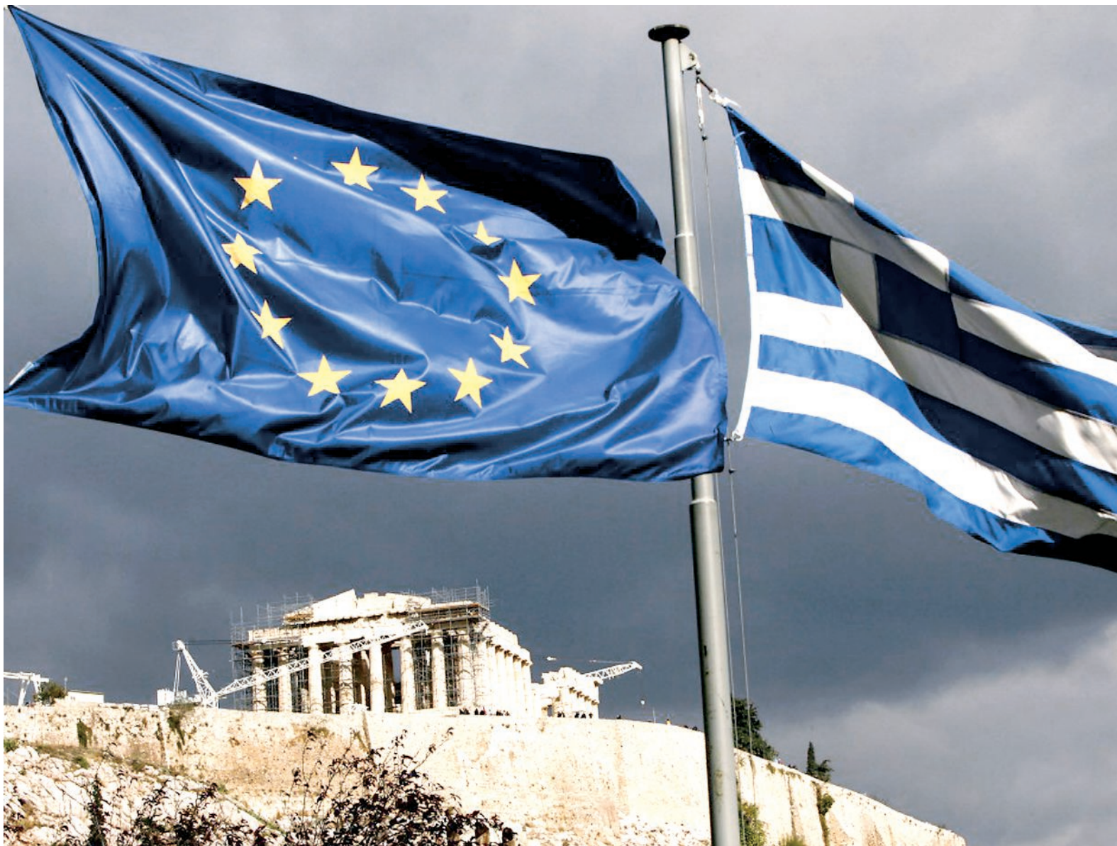
La permanencia de la llamada cuna de la civilización en la eurozona corre peligro.

El problema es que estos rescates multimillonarios sólo han significado alivios temporales, ya que su objetivo no es reactivar la economía, la generación de empleos, la competitividad, las exportaciones del conjunto de la Unión Europea, sino rescatar, a costa de la economía real y del bienestar de la mayoría de los europeos, a los bancos que están al borde de la quiebra.