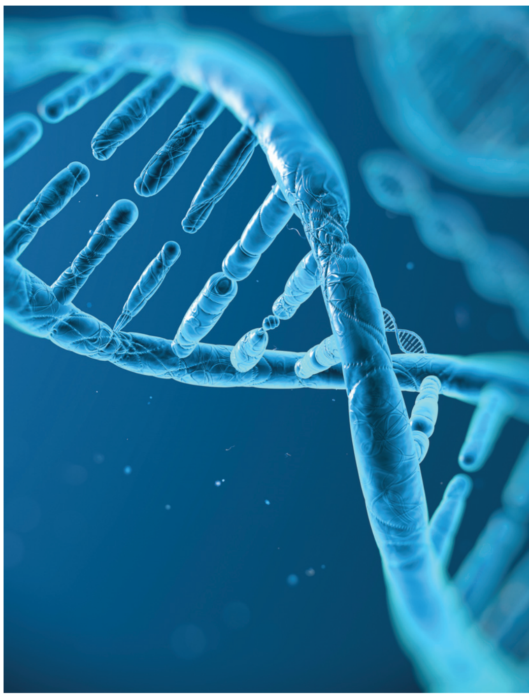
La reparación del ácido desoxirribonucleico es un proceso básico para la subsistencia del ser humano.