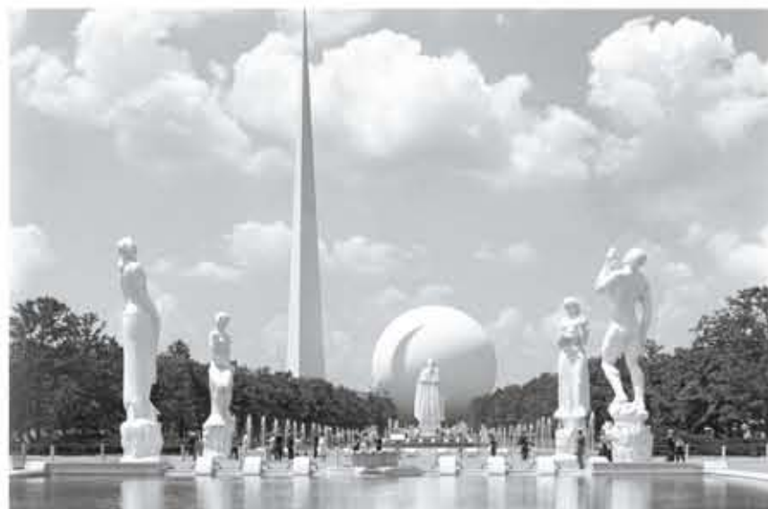
SÍMBOLOS. Estatua de Washington y los símbolos de la feria: el trilón y la perisfera

Luego de una larga ausencia de setenta años, el gran fotógrafo mexicano es objeto de una espléndida exposición en el Museo de Arte de Queens