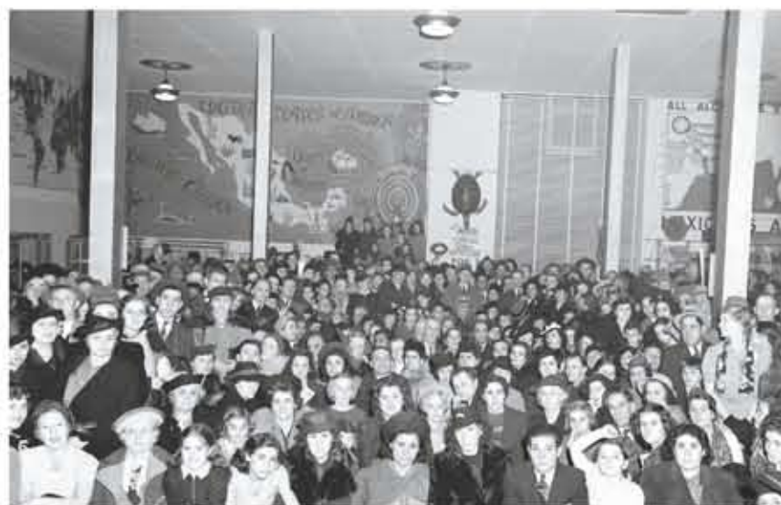
GENTÍO. Vista de la multitud que abarrotó el pabellón de México en la feria

danzas típicas de México", comenta el fotógrafo y curador universitario.