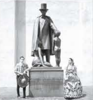
PAREJA. Charro y china pobлана junto al monumento a Lincoln

Como otras ferias mundiales o exposiciones que tratan de recuperar ciertas zonas de pauperadas de una ciudad y darles un valor comercial, la Feria Mundial de Nueva York de 1939-1940 se levantó en los terrenos que había ocupado un antiguo basurero en Queens.