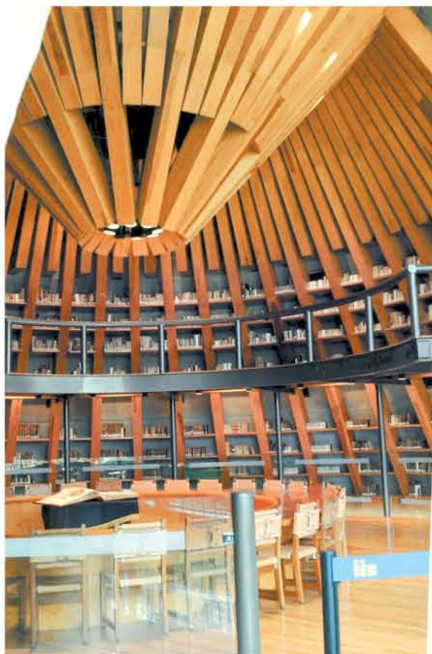
LUGAR EXCEPCIONAL. Se distingue por su magnífico diseño cónico, su estantería de madera y su mesa redonda

En oposición a este trabajo, destaca la obra Libra astronómica y filosófica , escrita en 1681 por Carlos de Sigüenza y Góngora y publicada en