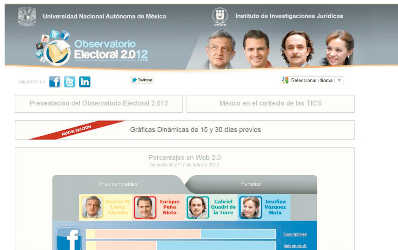
EN LÍNEA. Es un proyecto netamente académico, imparcial e incluyente

PERMITE DAR SEGUIMIENTO AL COMPORTAMIENTO DE CADA UNO DE LOS CANDIDATOS A LA PRESIDENCIA DEL PAÍS EN INTERNET Y REDES SOCIALES