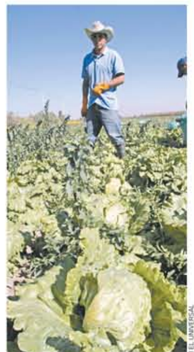
REALIDAD. Invisibles productores de riqueza que no disfrutan